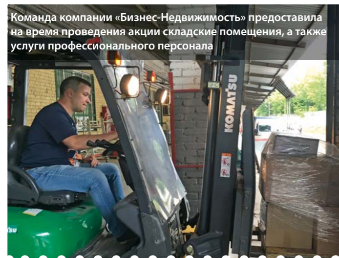
Команда компании «Бизнес-Недвижимость» предоставила на время проведения акции складские помещения, а также услуги профессионального персонала

Около двух тонн гуманитарной помощи общим объемом более 11 кубометров было отправлено для детей из социально незащищенных и малообеспеченных семей отдаленных сел Кош-Агачского района Республики Алтай.