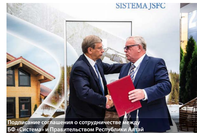
Подписание соглашения о сотрудничестве между БФ «Система» и Правительством Республики Алтай