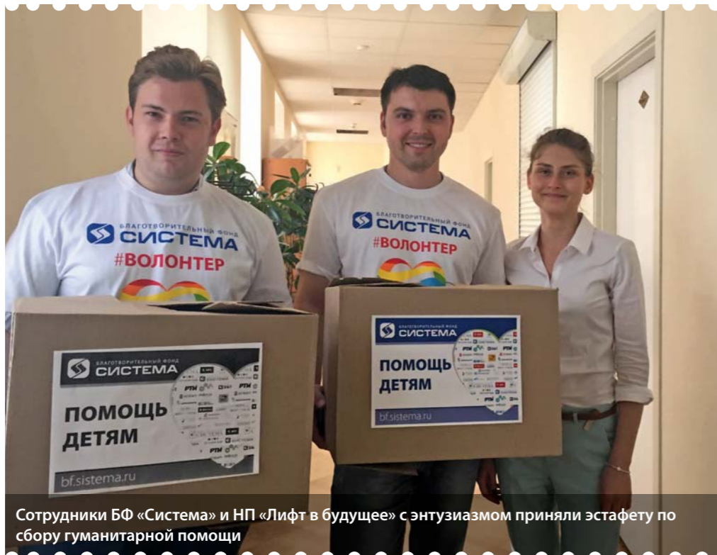
Сотрудники БФ «Система» и НП «Лифт в будущее» с энтузиазмом приняли эстафету по сбору гуманитарной помощи

Около двух тонн гуманитарной помощи общим объемом более 11 кубометров было отправлено для детей из социально незащищенных и малообеспеченных семей отдаленных сел Кош-Агачского района Республики Алтай.